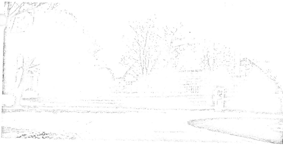
Idrætshallen i Åbo.

Prisen for stævnet har vi endnu ikke fået oplyst. Tilmelding til stævnet vil foregå til sekretariatet i Holstebro, og det må forventes, at den sidste frist for tilmelding bliver den 31. marts 1985. Tilmeldingsskemaer bliver udsendt til foreningerne i januar måned.